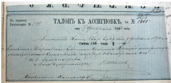
Рис. 2. Квитанція на асигнування витрат по справі А. Богуща

Стаття надійшла до редакції 09.10.2020 р.