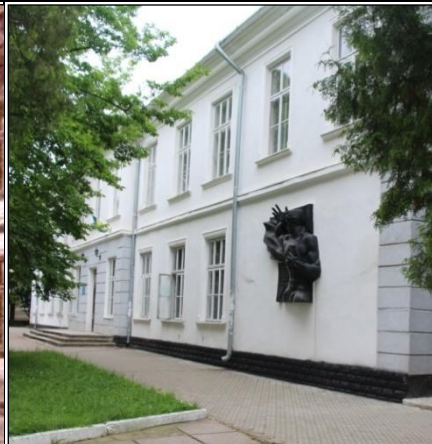
Теперішній вигляд. червень 2016 р.

Основною перешкодою була так звана система Баха, яка діяла аж до 1860 р. Ставлення влади до середніх шкіл мало чим відрізнялося від освітньої політики попереднього уряду, і бахівський бюрократ так само був переконаний, що для імперії достатньо тих спеціалістів та «вчених», яких «понаплоджували» вже наявні гімназії, а відкривати нові зовсім не було сенсу. Розуміючи ситуацію і знаючи, як зреагує уряд на прохання відкрити гімназію в Дрогобичі, гміна міста вирішила звернутися безпо-