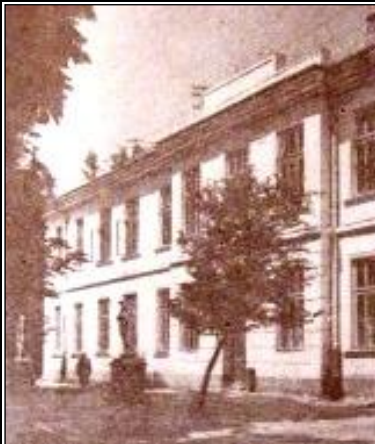
Світлина першої половини XX ст. Подається за: [7, 48]