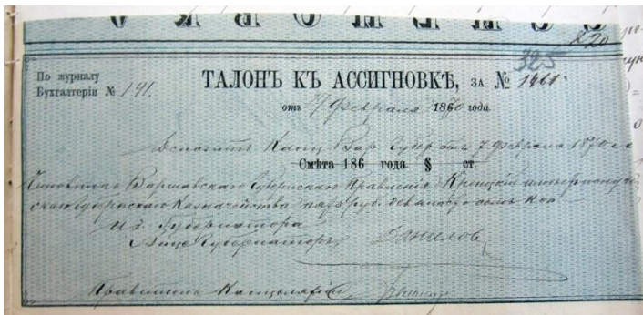
Рис. 2. Квитанція на асигнування витрат по справі А. Богуща

Стаття надійшла до редакції 09.10.2020 р.